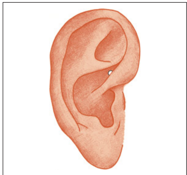
Abb. 1: Punkt Omega 1 nach Bahr

Es gilt, die beim Ausbohren entstehende Belastung sowohl für Patient als auch Zahnarzt zu reduzieren (s.o.). Die Akupunktur bietet zusätzlich sehr wirksame Möglichkeiten der Stärkung, damit der Körper mit der Belastung besser umgehen kann. Man kann die Nadeltherapie begleitend zum Aus-