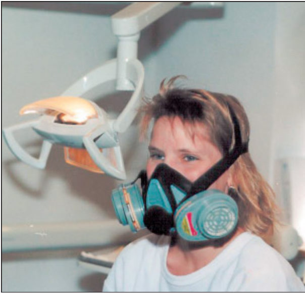
Abb. 5: Atemschutzmaske mit Spezial-Quecksilberfiltern