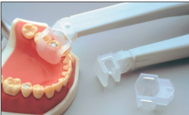
Abb. 4: Spezialabsaugung Clean Up® (Scania)

Die Spezialabsaugung ist als einfaches, kostengünstiges Verfahren (1 Set ca. 6 Euro) und an jeder zahnärztlichen Behandlungseinheit einsetzbar: Die Spezial-Saugkanüle wird nach Aufsatz eines im Lie-