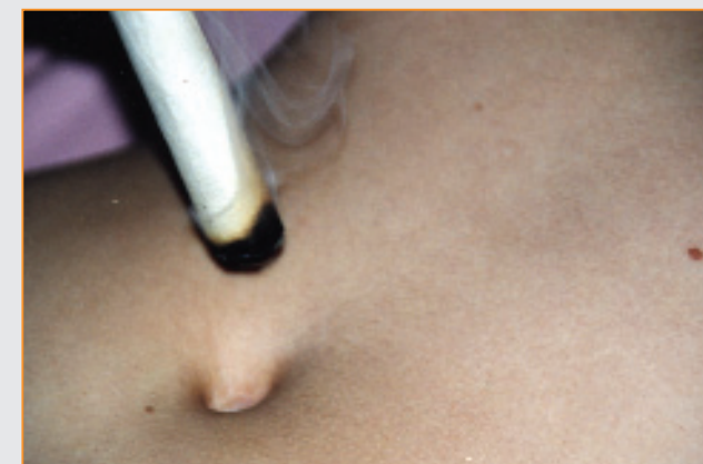
Moxibustion des Bauchnabels

Verstärkt wird die Wirkung der Nadeltherapie durch Moxibustion, einer angenehmen Erwärmung durch Annähern einer glühenden „Moxa-Zigarre“ (aus Beifuß-Blättern) an die zu behandelnden Bereiche.