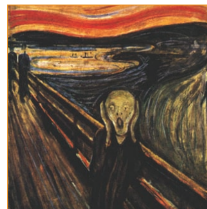
Darstellung von Schmerz in der Kunst: Edvard Munch „Der Schrei“

Die Behandlung ist häufig komplex, individuell unterschiedlich und besteht aus mehreren Bausteinen. Beim multimodalen Therapieprogramm sollten ganzheitliche Verfahren bevorzugt werden. Damit können Medikamente eingespart werden, die leider oft mit Nebenwir-