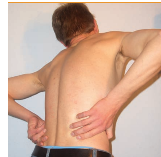
Neben Kopfschmerzen zählen Rückenschmerzen zu den häufigsten Beschwerden.

Zu den psychologischen Verfahren gehören auch Muskelentspannungsverfahren , durch die der Patient die Erfahrung macht, dass er auch selbst etwas gegen den Schmerz unternehmen kann. Zum Beispiel lernt er bei der progressiven Muskelentspannung nach