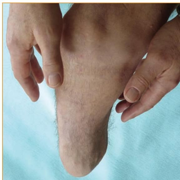
Eine peinigende Belastung: der Stumpf- oder Phantomschmerz

Bei der Schmerzbehandlung spielen Medikamente eine wichtige Rolle. Diese Substanzen verringern bzw. unterdrücken die Schmerzleitung, Schmerzempfindung und Schmerzverarbeitung und wirken im Bereich des Nervensystems, ohne einen narkotisierenden Effekt zu erzielen. Nach ihrer Wirkung werden zwei Gruppen von Schmerzmedikamenten unterschieden. Die schwach bis mittelstarken Nicht-Opioid-Analgetika wirken vorwiegend im Körpergewebe und verhindern hier eine Sensibilisierung der Schmerzfühler. Hingegen wirken die mittelstark bis starken Opioid-Analgetika überwiegend im Zentralnervensystem und können dort die Schmerzleitung herabsetzen bzw. ausschalten. Eine Kombination beider Medikamentengruppen ist häufig vorteilhaft, da diese sich in ihrer Wirkung gegenseitig verstärken.